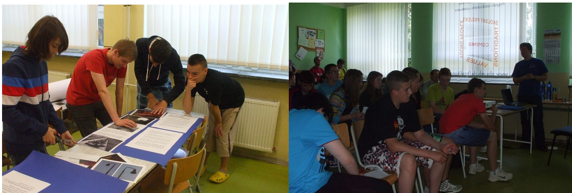
Obrázok 2. členovia astronomického krúžku pripravujú výstavu a astronomický kvíz.

Členovia astronomického krúžku pripravili vo vestibule školy aj výstavu venovanú problému svetelného znečistenia.