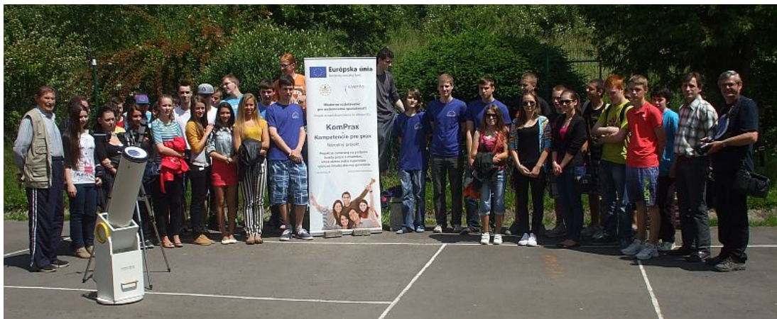
Obrázok 5. Spoločná fotografia účastníkov podujatia

Krásnu prírodu nášho Podpoľania si treba chrániť, to učíme už malé deti. Podpoľanie má na rozdiel od iných regiónov na Slovensku aj tú výhodu, že tu v noci ešte vidieť na oblohe hviezdy. Obyvatelia veľkých miest nám toto môžu len závidieť. Dokedy však? Svetlo v noci predstavuje vážny ekologický problém. Na Slovensku máme v súčasnosti dve chránené oblasti, v ktorých sa snažíme zachovať nočnú oblohu pre budúce generácie – Park tmavej oblohy Poloniny a Beskydskú oblasť tmavej oblohy.